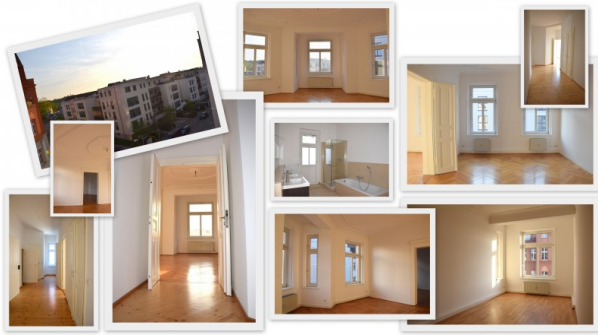
Stallbaum 20, 3 Collagen