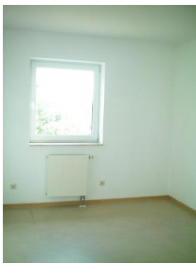
Referenzbild Kind 2