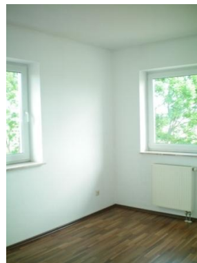
Referenzbild Kind 1