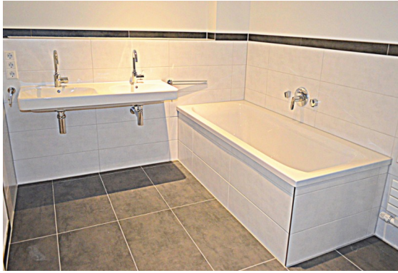
Bad mit Wanne & Dusche