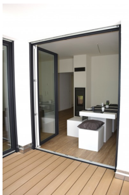
Blick Loggia WZ