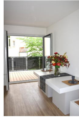
Küche Zugang Loggia